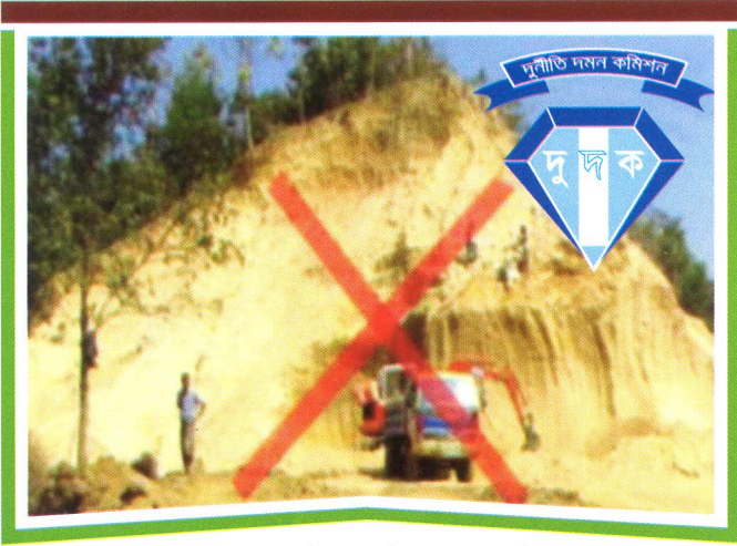
সিলেট পাহাড়ে তাৎক্ষণিক অভিযান চালিয়ে পাহাড় কাটা বন্ধ করে দুদক