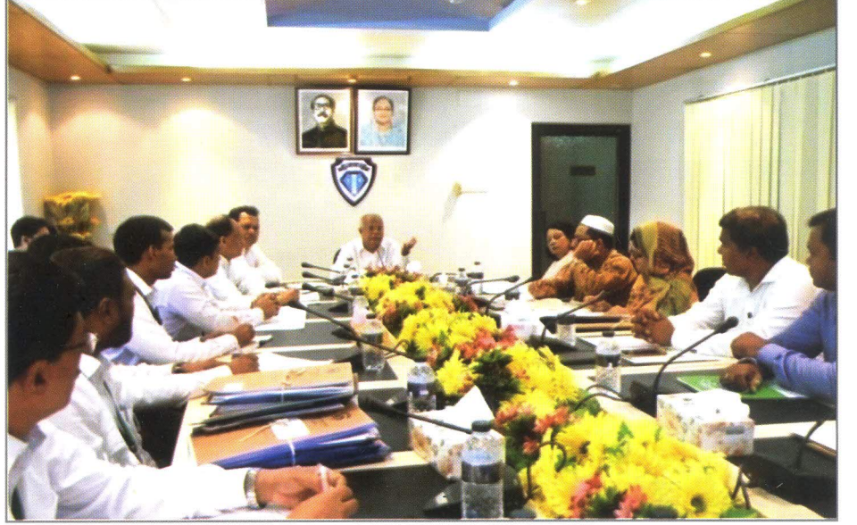
এফ.এম বেতারের ভূমিকা শীর্ষক মতবিনিময় সভায় বক্তব্য রাখছেন দুর্দক চেয়ারম্যান