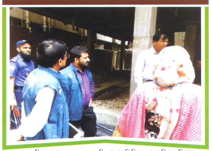
দুদক অভিযোগ কেন্দ্র -১০৬ এ অভিযোগের ভিত্তিতে তাৎক্ষণিক অভিযান