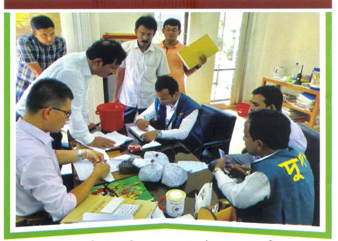
মাদকদ্রব্য নিয়ন্ত্রন অধিদপ্তরের ঢাকা কার্যালয়ে দুদকের অভিযান