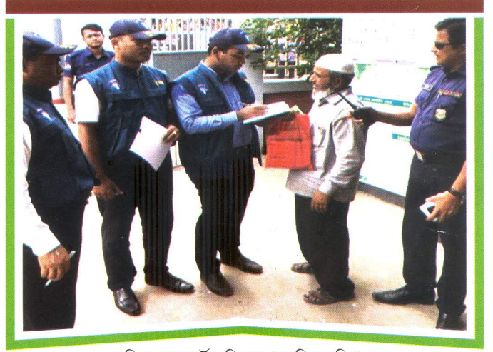
কুমিল্লা পাসপোর্ট অফিসে তাৎক্ষণিক অভিযান