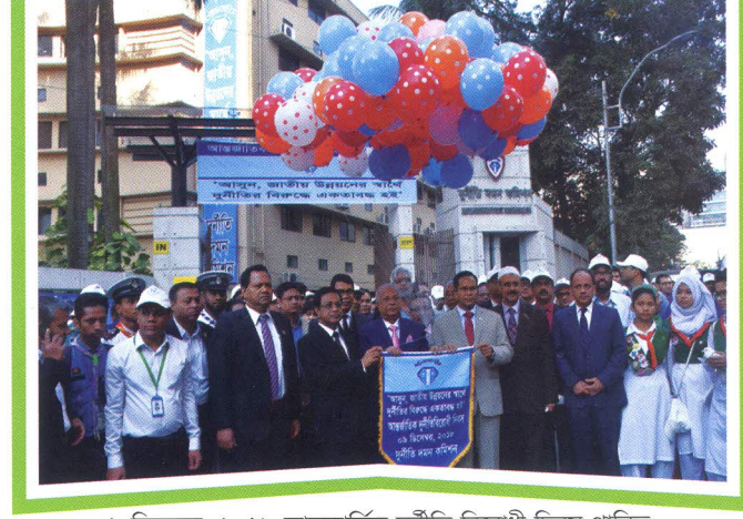
৯ ডিসেম্বর, ২০১৮ আন্তর্জাতিক দুর্নীতি বিরোধী দিবস পালিত