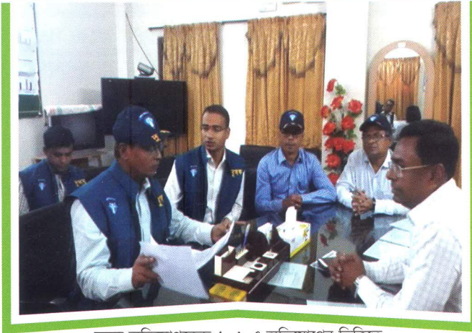
দুদক অভিযোগকেন্দ্র-১০৬ এ অভিযোগের ভিত্তিতে কুমিল্লা সিভিল সার্জন অফিসে তাৎক্ষণিক অভিযান