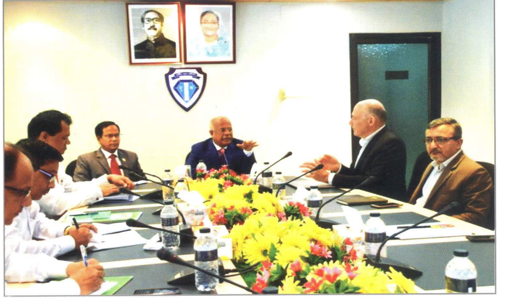
হংকংয়ের আইসিএসি এর নির্বাহী পরিচালকের সাথে মতবিনিময় সভায় বক্তব্য রাখছেন দুর্দক চেয়ারম্যান।