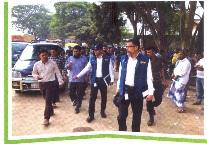
দুদক অভিযোগকেন্দ্র-১০৬ এ অভিযোগের ভিত্তিতে BRTA ইকুরিয়া কার্যালয়ে তাৎক্ষণিক অভিযান