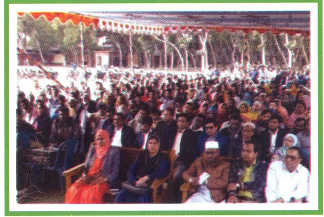
গণশুনানিতে উপস্থিত দর্শকবৃন্দ।