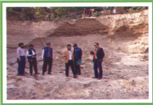
দুদক অভিযোগকেন্দ্র-১০৬ এ অভিযোগের ভিত্তিতে তাত্ক্ষণিক অভিযান।