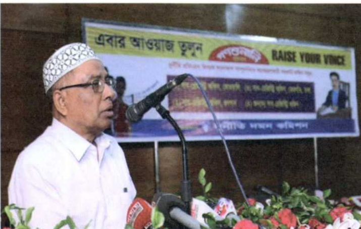
গনশুনানিতে বক্তব্য রাখছেন দুদক কমিশনার ড. নাসিরউদ্দিন আহমেদ।