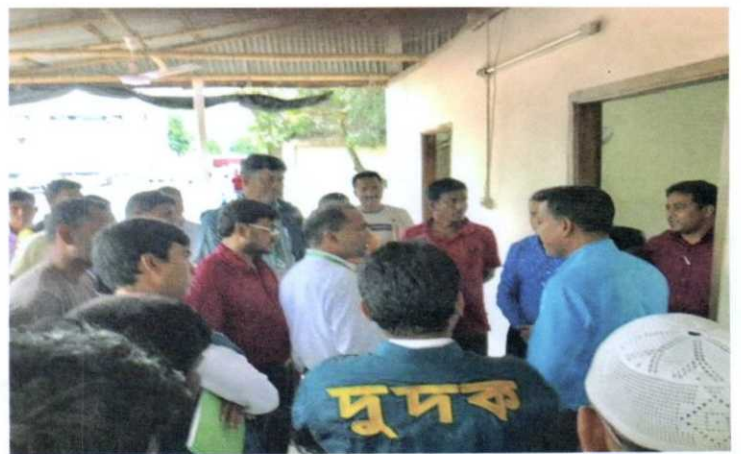
দুদক অভিযোগকেন্দ্র-১০৬ এ অভিযোগের ভিত্তিতে তাত্ক্ষণিক অভিযান।