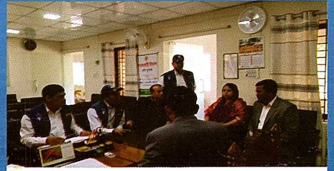
দুদক অভিযোগকেন্দ্র-১০৬ এ অভিযোগের ভিত্তিতে তাৎক্ষণিক অভিযান।

মানুষ যুগ দেয়া বন্ধ করলে, ফাইল আটকে রাখারও অবসান ঘটবে দুর্নীতিকে না বলি