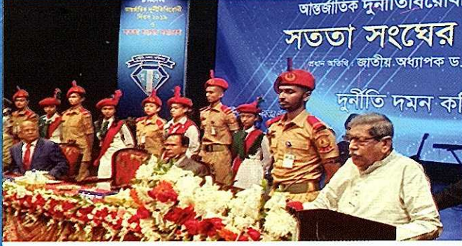
আন্তর্জাতিক দুর্নীতিবিরোধী দিবস উপলক্ষে প্রধান অতিথির বক্তব্য রাখছেন জাতীয় অধ্যাপক ড. আনিসুজ্জামান।