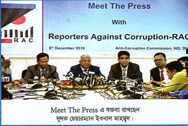
Meet The Press এ বক্তব্য রাখছেন দুদক চেয়ারম্যান ইকবাল মাহমুদ।