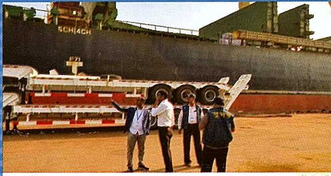
দুদক অভিযোগকেন্দ্র-১০৬-এ অভিযোগের ভিত্তিতে তাৎক্ষণিক অভিযান।